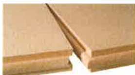
木質系断熱材 「パヴァテックス」