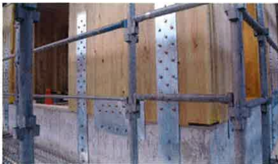
写真④ 基礎とCLTパネルの接合部（施工中の写真）