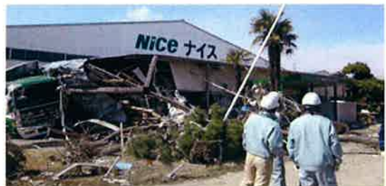
東日本大震災直後の仙台物流センター